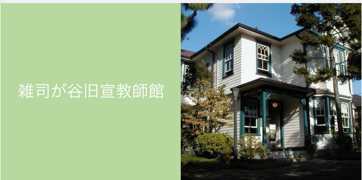
雑司が谷旧宣教師館

このシンポジウムでは、雑司ヶ谷の道の魅力を引き出しながら、改めて地域のつながりについて考えてみたいと思います。