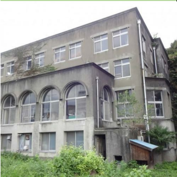
日本女子大学明桂寮