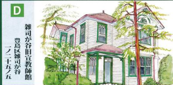
D 雑司が谷旧宣教師館 豊島区雑司が谷 一ノ二十五ノ五