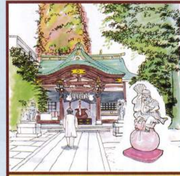
恵比壽神 大鳥神社 豊島区雑司が谷3-20-14