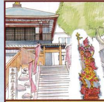
毘沙門天 清立院 豊島区南池袋4-25-6