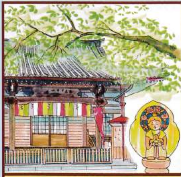
華の福祿壽 仙行寺 豊島区南池袋2-20-4