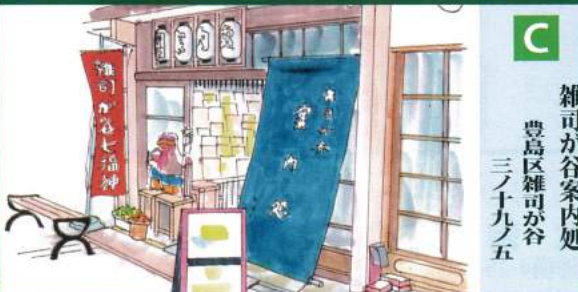
C 雑司が谷案内処 豊島区雑司が谷 三ノ十九ノ五