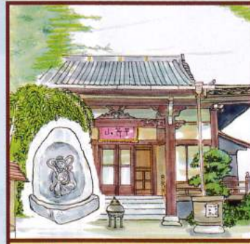
弁財天 観静院 豊島区南池袋3-5-7