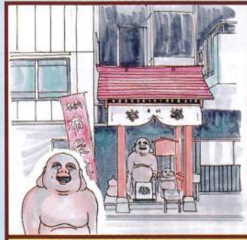
布袋尊 中野ビル 豊島区南池袋2-12-5