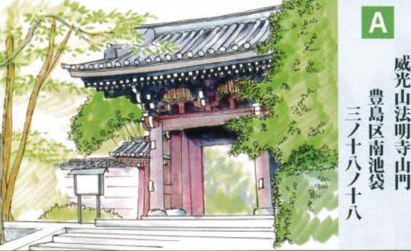
A 威光山法明寺山門 豊島区南池袋 三ノ十八ノ十八