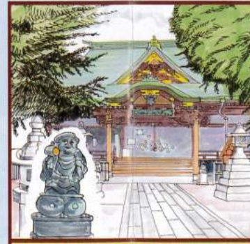
大黒天 鬼子母神堂 豊島区雑司が谷3-15-20