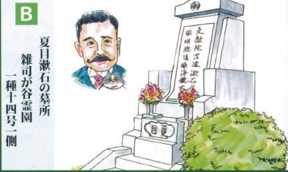
B 夏目漱石の墓所 雑司が谷霊園 一種十四号二側