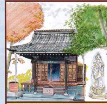
吉祥天 清土鬼子母神 文京区目白台2-14-9